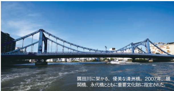
隅田川に架かる、優美な清洲橋。2007年、勝鬨橋、永代橋とともに重要文化財に指定された。

路町辺りには、神田川を船で運ばれた青果が荷揚げされ、大正時代まで、巨大な青果市場がありました。そしてこのクルーズの見どころは、日本橋川、隅田川、神田川に架かる美しいデザインの橋の数々。隅田川ではさまざまな橋と東京スカイツリーのコラボが楽しめます。