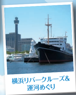
横浜リバークルーズ& 運河めぐり