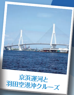
京浜運河と 羽田空港沖クルーズ