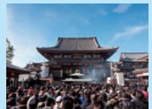
真言宗智山派大本山金剛山金乗院平間寺。通称「川崎大師」。