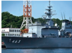
長浦港に停泊する掃海母艦「うらが」。機雷を除去する掃海艇の母艦。

そして横須賀本港と長浦港には、海上自衛隊の横須賀基地と米海軍第7艦隊が置かれ、護衛艦、掃海艇、潜水艦などさまざまな種類の艦船が停泊しています。これらを間近で見られるのが、汐入ターミナルから発着する「YOKOSUKA軍港めぐり」