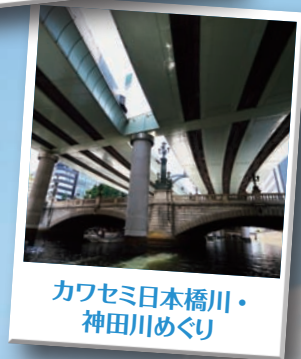
カワセミ日本橋川・ 神田川めぐり